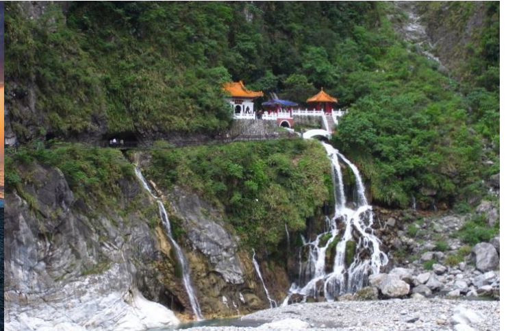
太魯閣國家公園 - 長春祠