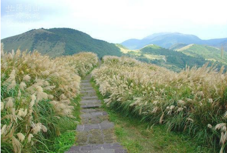
陽明山擎天崗芒花季節