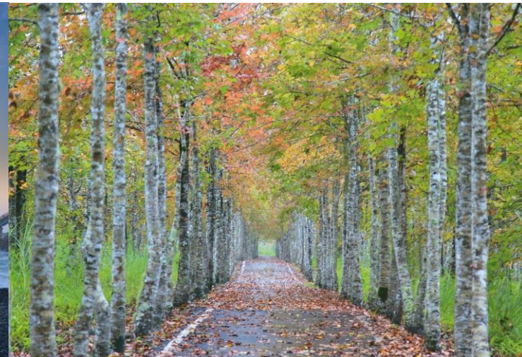
大農大富森林園區